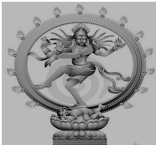
تصویر ۲ رقص شیوا danse-shiva-image

اما این رقص جهان که عرصه‌ی رقص خدای شیوا است، یکی از وجوه برهما سگونه ۱ می‌باشد. شیوا با رقص خود که پنج عمل و وظیفه‌ی او را نشان می‌دهد، چرخ حیات را می‌چرخاند. چنانکه ژرفترین مفهوم این رقص را زمانی حس می‌کند که انسان دریابد که عرصه‌ی این پایکوبی، قلب و خویشتن انسانی است و اینکه همه جا برهماست، زیرا همه جا قلب انسانی با خدا است (کوماراسوامی، ۱۳۹۰: ۱۵۹). رقص شیوا برخوردار از سه لایه می‌باشد ( تصویر ۲)، که در اولین لایه رقصی از نمایش آهنگین شیواست که به عنوان منشأ حرکات کیهانی است که این مفهوم از طریق قوس مشتعل منتقل می‌گردد، در دومین لایه، رقص شیوا به عنوان نمادی از رهایی ارواح انسان‌ها از دام مایا یا وهم است. در لایه‌ی سوم که در چیدامبارام قرار دارد و مرکز عالم به شمار می‌رود، مکان رقص شیواست که مکان حقیقی آن در قلب است (همان: ۱۶۷).